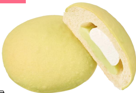
熊本肥後グリーンメロンパン 2月17日発売 165円

高い糖度が特徴の熊本県産「肥後グリーンメロン」のメロンクリームとホイップクリームが入ったもちっとした食感のメロンパンです。