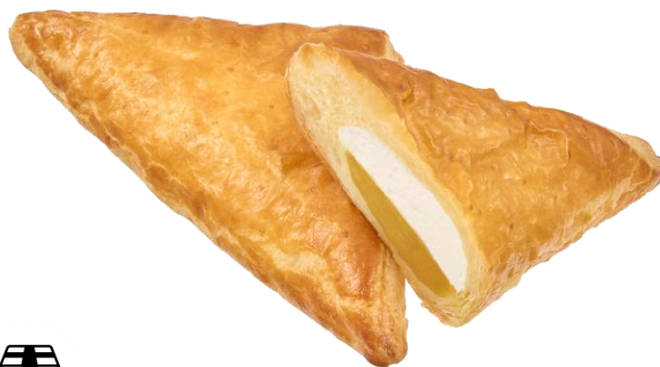
和栗あん＆ホイップパイ 2月24日発売 160円

パイ生地で熊本県産和栗のペースト入り栗味餡を包み三角形に焼き上げ、ミルク味ホイップを注入しました。