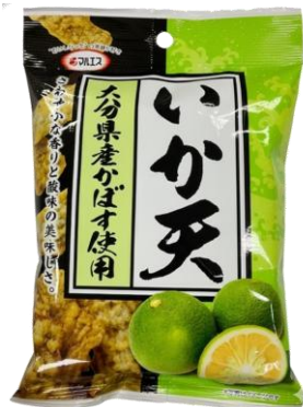
いか天大分県産かぼす味 2月24日発売 195円