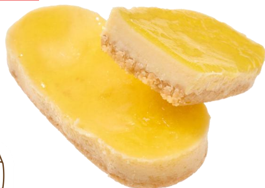
沖縄県産シークワサーのチーズケーキ 2月24日発売 298円

沖縄県産シークワサーのエードを使用したチーズケーキに、シークワサーのナパージュをかけました。