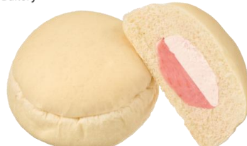
あまおういちご&ホイップ 155円（税込） 70ポイント