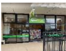
ジアウトレット湘南平塚店