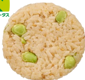
宮崎県産枝豆ごはんおにぎり 2月24日発売 175円

あごだしと九州の甘口醤油で炊き込んだ茶飯に、宮崎県産の枝豆と金胡麻を混ぜ込んだ、枝豆の味わいが感じられるおにぎりです。