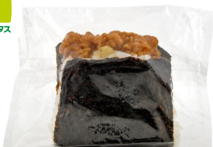
サンドおむすび チキン南蛮 2月24日発売 398円