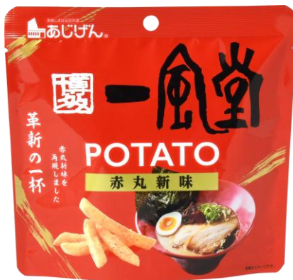
一風堂赤丸新味 ポテトスティック 2月17日発売 216円

福岡県産あまおういちごのクリームを包んで焼き上げた後、福岡県産あまおういちごのホイップクリームを入れました。