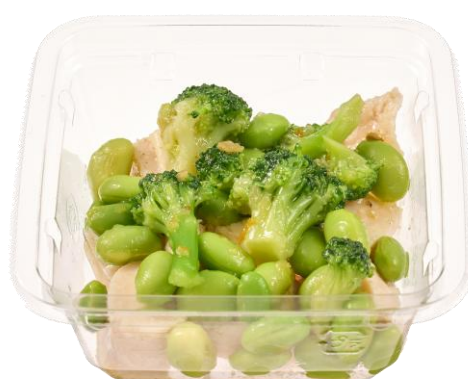
柚子胡椒香！ 低温調理チキンのサラダ (大分特産柚子胡椒使用) 2月17日発売 298円

ブロッコリー、枝豆を大分県名物の柚子胡椒で味付けしました。ピリッとした辛みと爽やかな風味の柚子胡椒がチキンと相性抜群です。