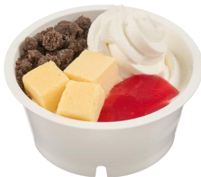
ヨーグルッペパフェ 2月24日発売 348円