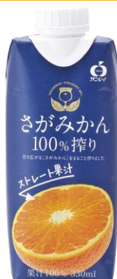
さがみかん100%搾り 発売中 293円

佐賀県産温州みかん果汁100%。おいしい時期に搾ったみかん果汁をそのままパックしました。