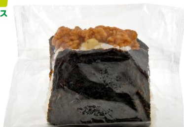
サンドおむすび チキン南蛮 398円（税込） 190ポイント