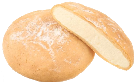
ふわもち ヨーグルッペクリーム 2月24日発売 210円

ヨーグルッペをイメージしたチョコとヨーグルッペ味のビスケット生地のチョコづくしです。