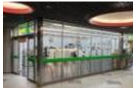
コクーンタワー新宿店