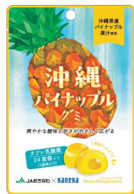
沖縄パイナップルグミ ラブレ乳酸菌入 2月17日発売 149円 沖縄県産パイナップルペーストを使用した果実ジュレ入りのグミです。ラブレ乳酸菌24億個入り。

スポンジの上に沖縄県産の紅芋を使用したクリームと沖縄県産の黒糖を使用した黒糖ソースをトッピングしました。