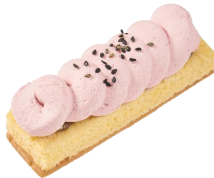
紅芋クリームスティックケーキ（沖縄県産紅芋使用） 2月17日発売 298円

スポンジの上に沖縄県産の紅芋を使用したクリームと沖縄県産の黒糖を使用した黒糖ソースをトッピングしました。