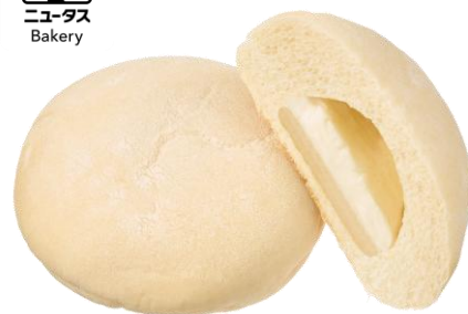
もちミルク 2月17日発売 145円

熊本阿蘇小国ジャージーの牛乳入りのミルククリームとおもちフィリングを包んで焼き上げました。優しい甘さとおもち食感が楽しめます。