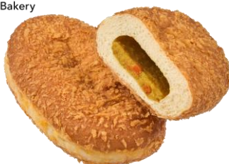
博多ナイルカレー監修 カレーパン 165円（税込） 80ポイント