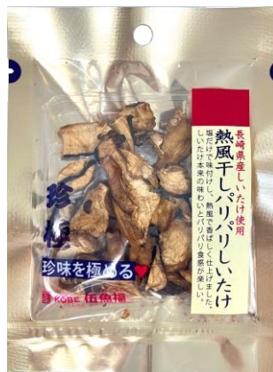
一杯の珍極プレミアム 熱風干しパリパリしいたけ 2月17日発売 450円

長崎新名物のちゃポリタン®をロールパンにはさみました。ちゃポリタン®はカゴメの商標です。