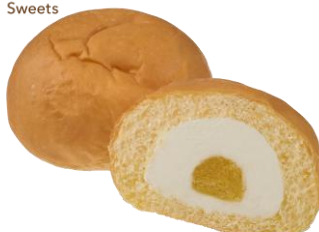
八天堂 とろけるくりーむパン 沖縄県産シークワサー 278円（税込） 130ポイント