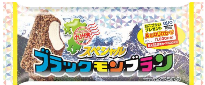
スペシャルブラックモンブラン 2月17日発売 183円

佐賀県産温州みかん果汁100%。おいしい時期に搾ったみかん果汁をそのままパックしました。