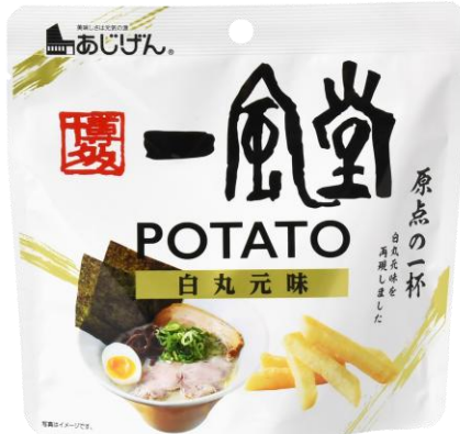
一風堂白丸元味 ポテトスティック 2月17日発売 216円

一風堂の「赤丸新味」特有の自家製の香味油と辛味噌を加え、コクと風味をポテトスティックで再現しました。