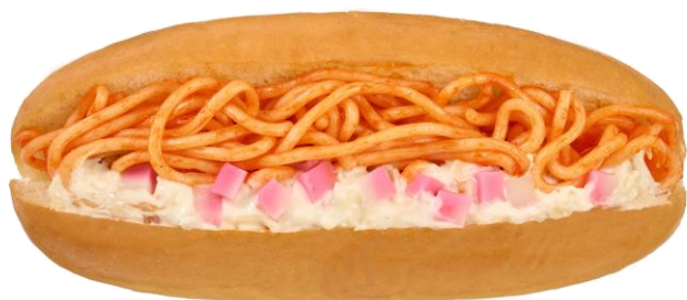
ちゃポリタン®ロール 2月24日発売 195円

長崎新名物のちゃポリタン®をロールパンにはさみました。ちゃポリタン®はカゴメの商標です。