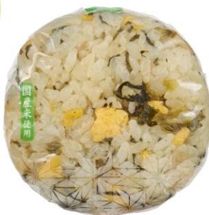
阿蘇高菜使用！ 高菜炒飯おにぎり 2月24日発売 208円

熊本県の阿蘇高菜を使用した炒飯おにぎりです。直火炒めの香ばしさと、阿蘇高菜の食感が楽しめます。