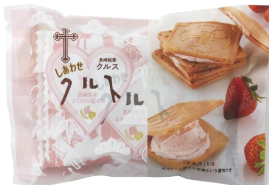
しあわせクルス 3枚入 2月24日発売 216円

長崎県産「幸の香」(さちのか) 苺を使用したチョコサンドです。この苺の名前と「食べた方に幸せが来ますように」との願いから、「しあわせクルス」と名付けました。