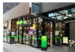
サウスゲート新宿店

NewDaysの平均日販 749千円 (2025年3月末時点) 「日経MJ」2024年度コンビニ調査 1店あたり平均日販ランキング第1位 ・営業時間が1日14時間以上 ・売場面積30㎡以上250㎡未満 ※商業統計調査に使用された基準を使用