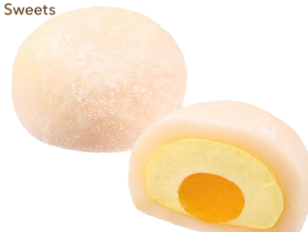
マンゴークリーム大福 195円（税込） 90ポイント