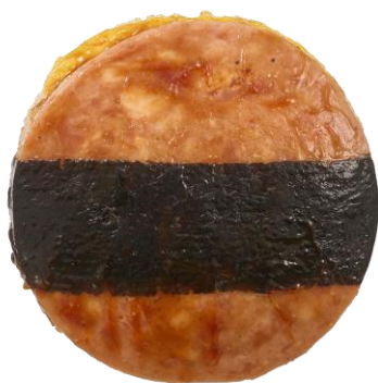
ポーク玉子おにぎり 2月24日発売 255円

沖縄の定番料理ポーク玉子をイメージしたおにぎりです。だしご飯に醤油を混ぜ込み、てりやき味のポークと玉子をのせ海苔で巻きました。味のアクセントにツナマヨを合わせました。