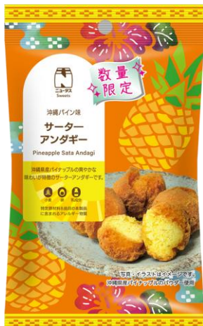
サターアングギー 沖縄パイン味 2月24日発売 198円

一口サイズで食べやすい、パイン風味のサターアングギーです。沖縄県産パイナップルの爽やかな甘みと風味が特徴です。4個入り。