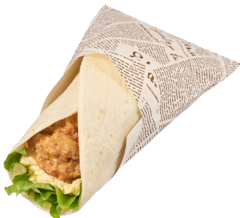
大分名物！ とり天&タルタルソースのトルティーヤ 2月17日発売 410円

とり天に甘辛いタレを絡めタルタルソースと合わせたトルティーヤです。とり天とタルタルソースのコクが相性抜群です。