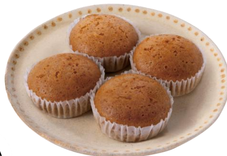
黒糖蒸しパン4個入 2月17日発売 170円