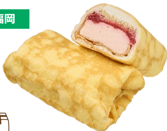
いちごのムースクレープ (福岡県産あまおう苺のピューレ入りジャム) 2月17日発売 198円

クレープにあまおう苺ジャムを使用した苺のムースとスポンジ、苺ジャム、ホイップを入れ包みました。