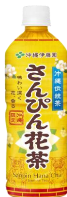
さんぴん花茶 600ml 2月17日発売 170円 心地よい花香との調和を実現し、現代的なあしらいで、花の香りでリラックスをお届けする想いを表現をしたデザインです。貴重な伝統文化を後世に紡ぐ活動として、売上の一部を「首里城基金」に寄付しています。