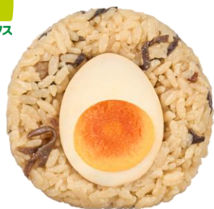
熊本ラーメン風おにぎり 2月17日発売 230円

マー油の香りと、とんこつ濃厚な旨味が感じられる熊本ラーメンをイメージしたおにぎりです。