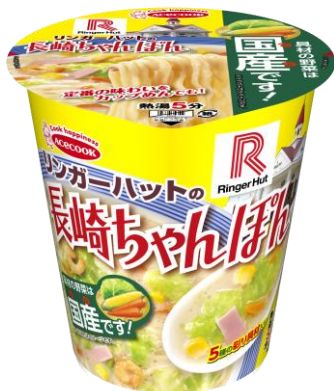
リンガーハットの長崎ちゃんぽん 2月17日発売 293円