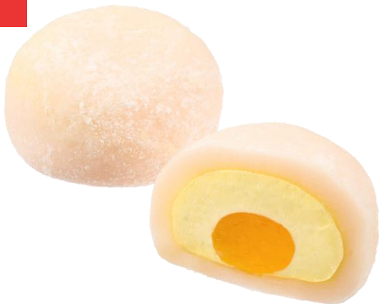
マンゴークリーム大福 2月17日発売 195円

沖縄県産マンゴーピューレを使用したマンゴーソースとマンゴークリームを大福生地で包みました。