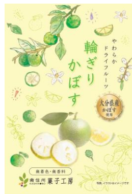
大分県産 輪ぎりかぼす 2月17日発売 248円

大分県産のかぼすを使用しています。食べやすいサイズにカットし、やわらかな食感のドライフルーツに仕上げました。