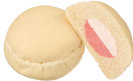
あまおういちご & ホイップ 2月24日発売 155円

福岡県産あまおういちごのクリームを包んで焼き上げた後、福岡県産あまおういちごのホイップクリームを入れました。