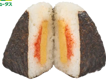
大きなおにぎり 博多明太子と玉子焼 2月17日発売 298円

ご飯をたっぷり食べたい方におすすめの大きなおにぎりです。博多明太子に玉子焼を合わせました。