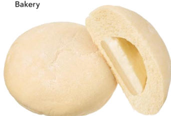
おもちミルク 145円（税込） 70ポイント