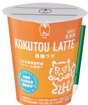
黒糖ラテ 発売中 255円